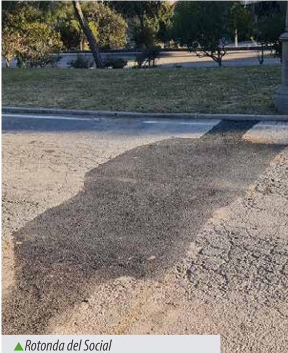
▲ Rotonda del Social

Seguimos con la reparación de los tramos de pavimento en mal estado, por baches, apertura de zanjas o nuevas instalaciones. Para estos trabajos se está realizando un relleno de la zanja con tierras compactadas, zahorras, hormigón y acabado en asfalto en frío. Estos trabajos se están realizando con personal interno del Club.