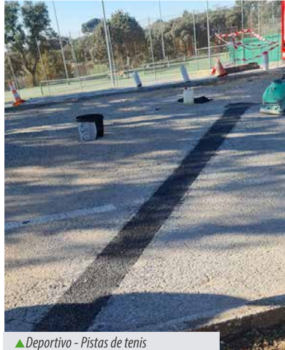
▲ Deportivo - Pistas de tenis